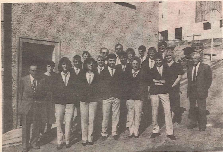
D'Fanfare Kischpelt 1988